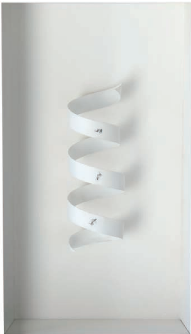
El viaje. Emulsión fotográfica en técnica mixta. Barcelona, 2007. 39 x 23,5 x 9 cm.