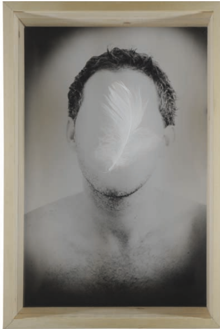
Francesc. Gelatinobromuro de plata y pluma en técnica mixta. Barcelona, 2008. 37,5 x 25 x 9 cm.