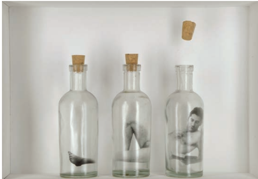
Tres tramos. Emulsión fotográfica sobre vidrio y tapones de corcho en técnica mixta. Barcelona, 2008. 25 x 35 x 9 cm.