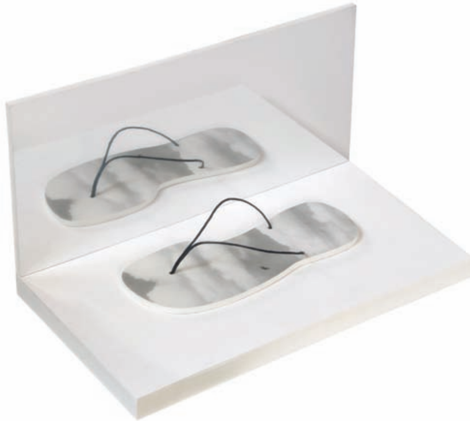
Chancleta. Emulsión fotográfica sobre tabla, cordón y espejo en técnica mixta. Barcelona, 2008. 22,5 x 40,5 x 22 cm.