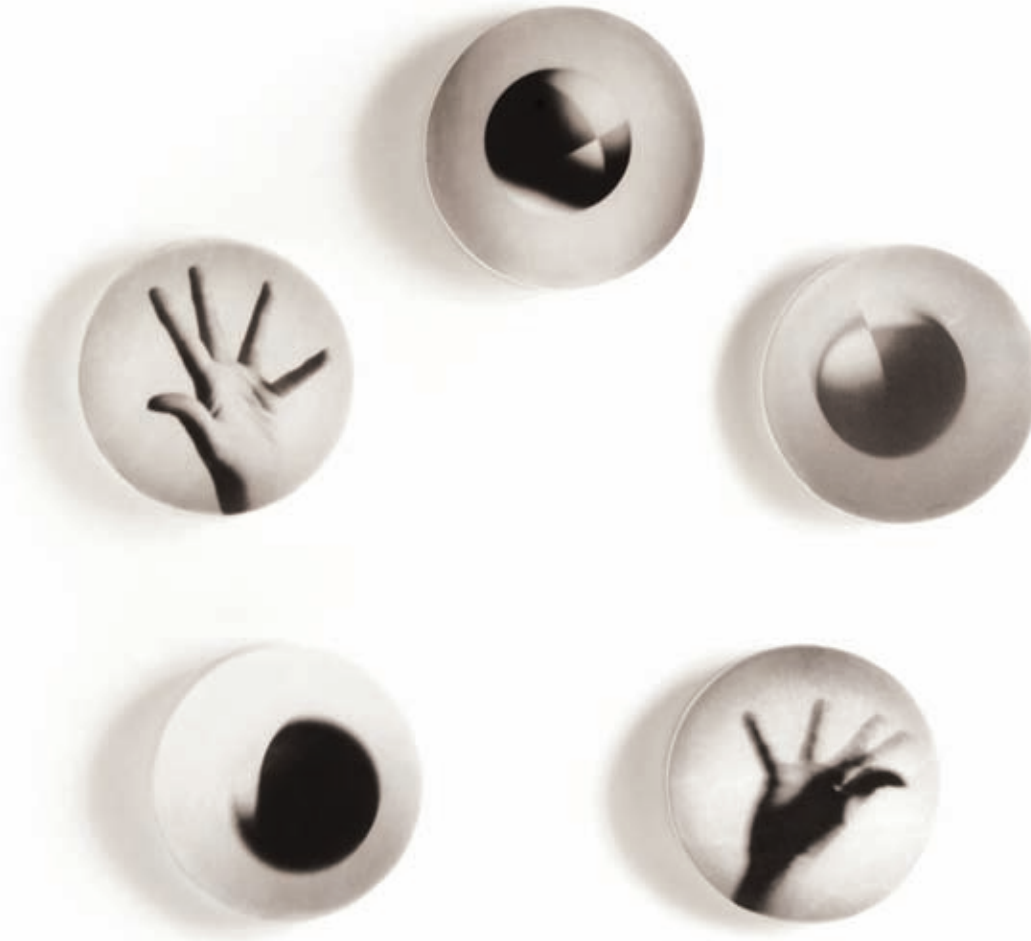
Pelotitas . Emulsión fotográfica sobre tabla. Barcelona, 2008. 80 x 80 cm.