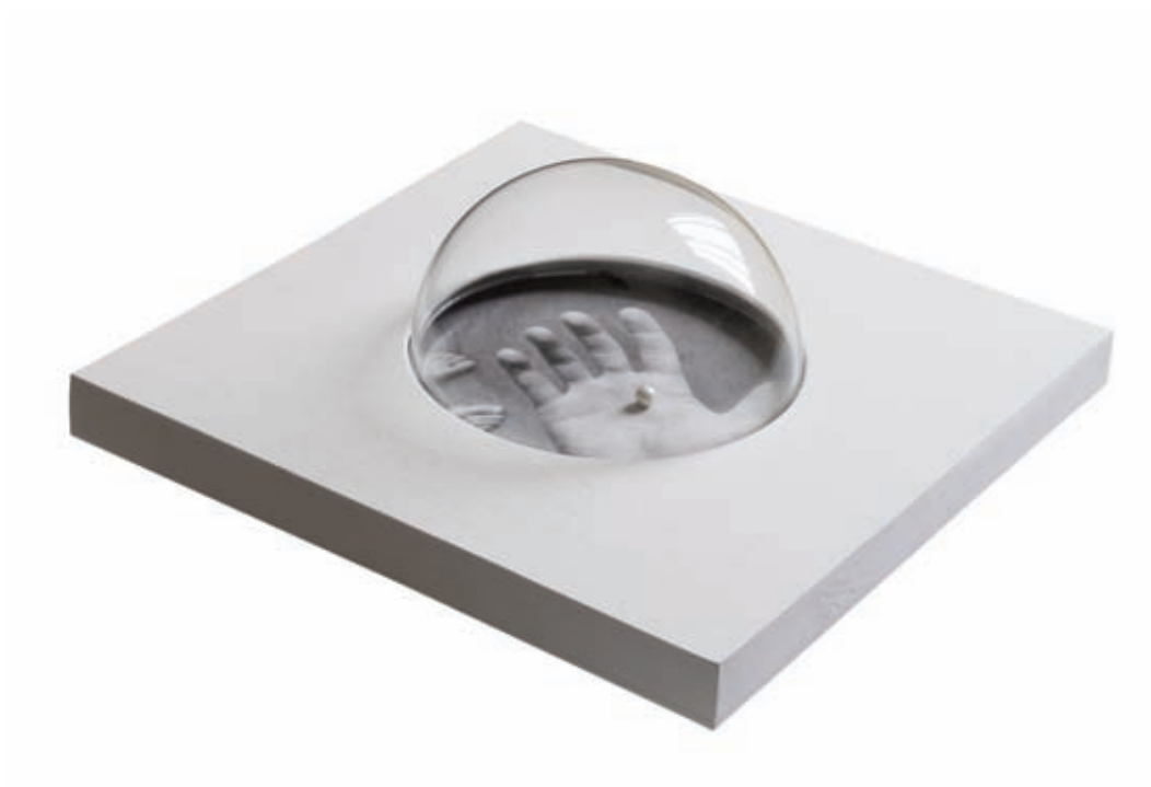
Mano sosteniendo perla. Gelatinobromuro de plata y perla en técnica mixta. Barcelona, 2007. 10 x 30 x 30 cm.