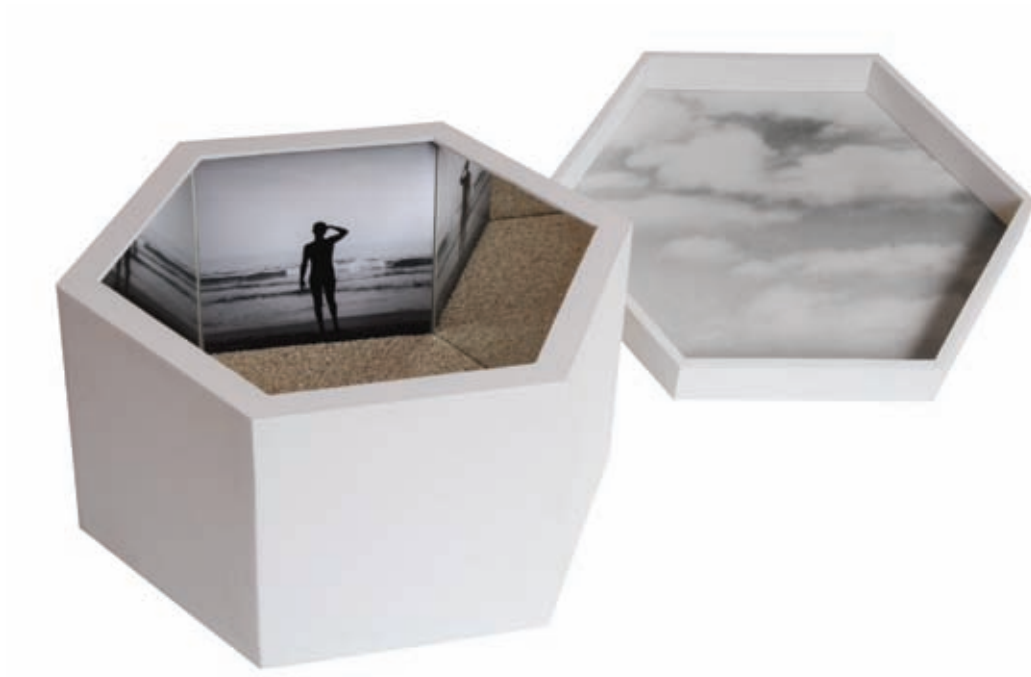
La observación (interrogarse). Emulsión fotográfica, espejos y arena en técnica mixta. Barcelona, 2005. 12 x 31 x 27 cm.