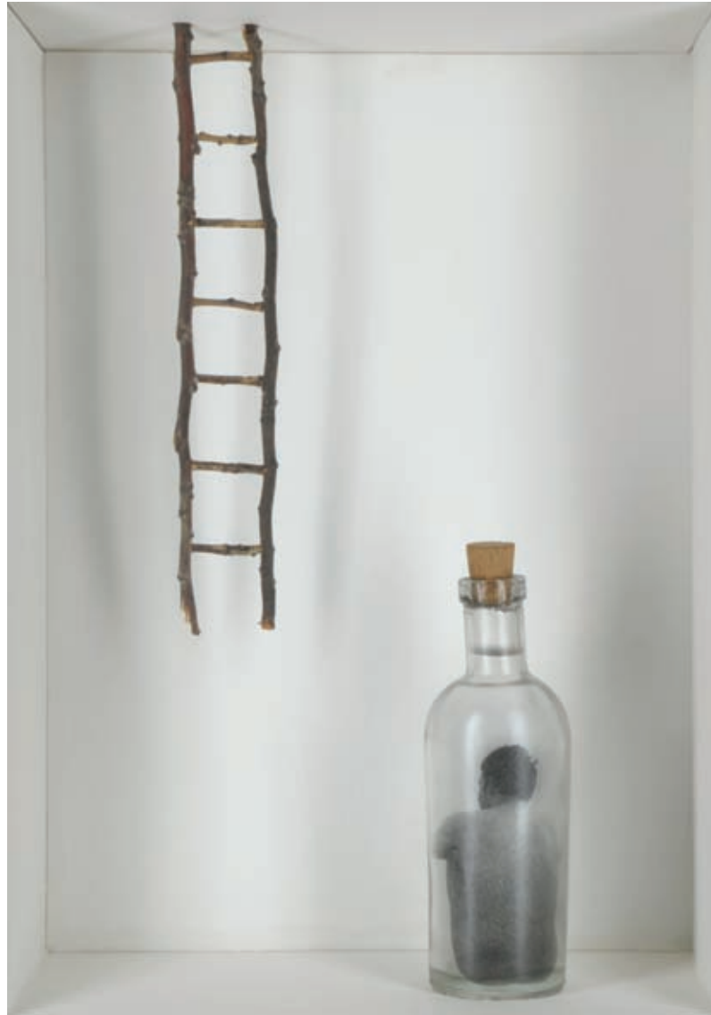
Subir . Emulsión fotográfica sobre vidrio, tapón de corcho y escalera en técnica mixta. Barcelona, 2008. 37,5 x 27,5 x 12 cm.