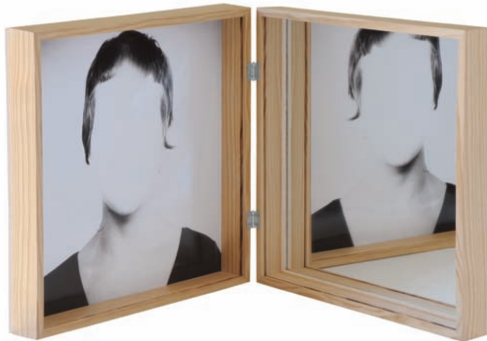
Maritxu . Gelatinobromuro de plata y espejo en técnica mixta. Barcelona, 2008. 30,5 x 56 x 21 cm.