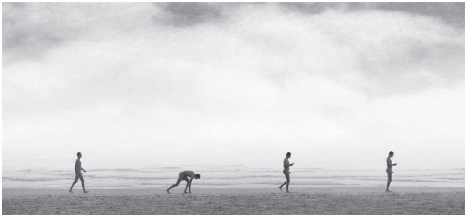
Mirar. Lambda Proláser. Barcelona, 2005. 15 x 100 cm.