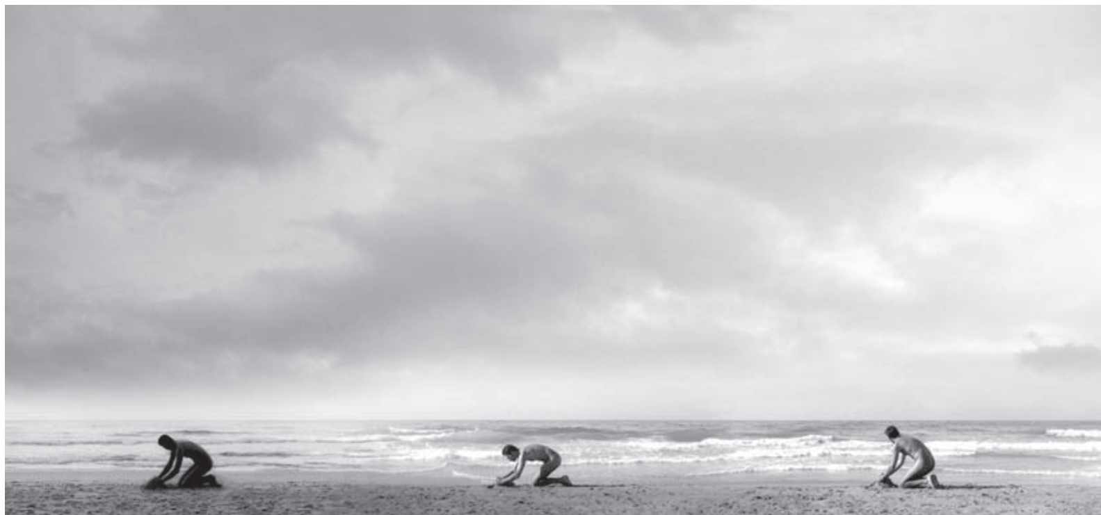
Ver. Lambda Proláser. Barcelona, 2005. 15 x 100 cm.