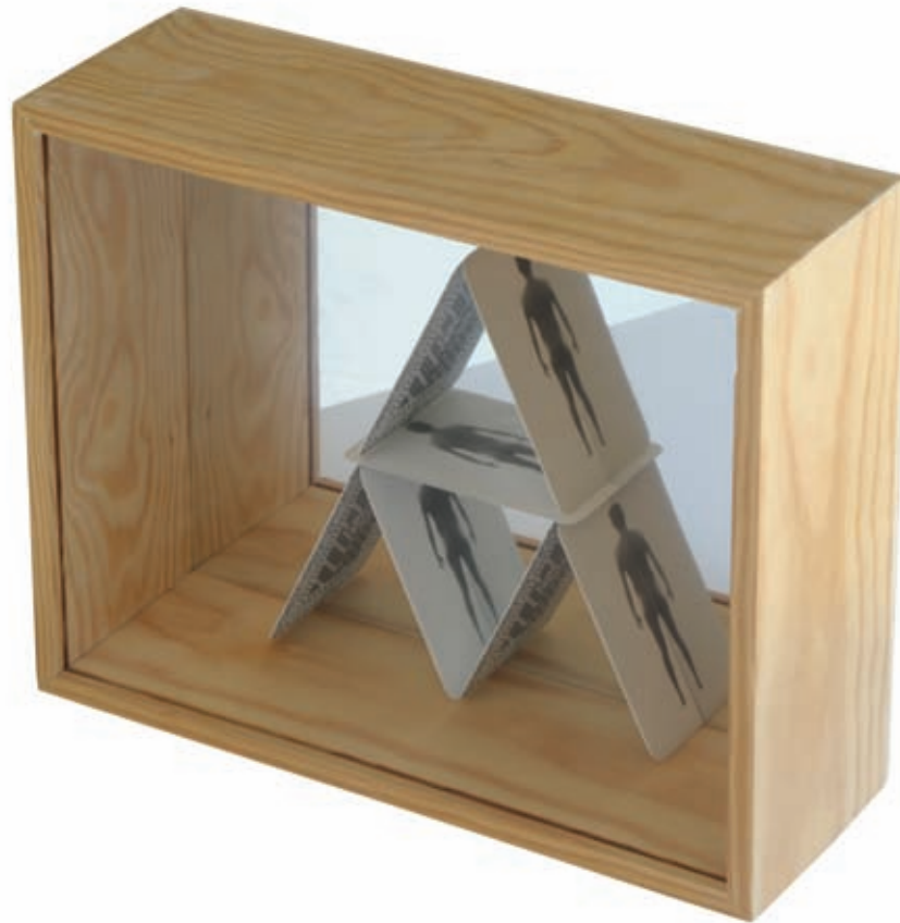
Reunir . Emulsión fotográfica sobre metal y espejo en técnica mixta. Barcelona, 2007. 22 x 27 x 9,5 cm.