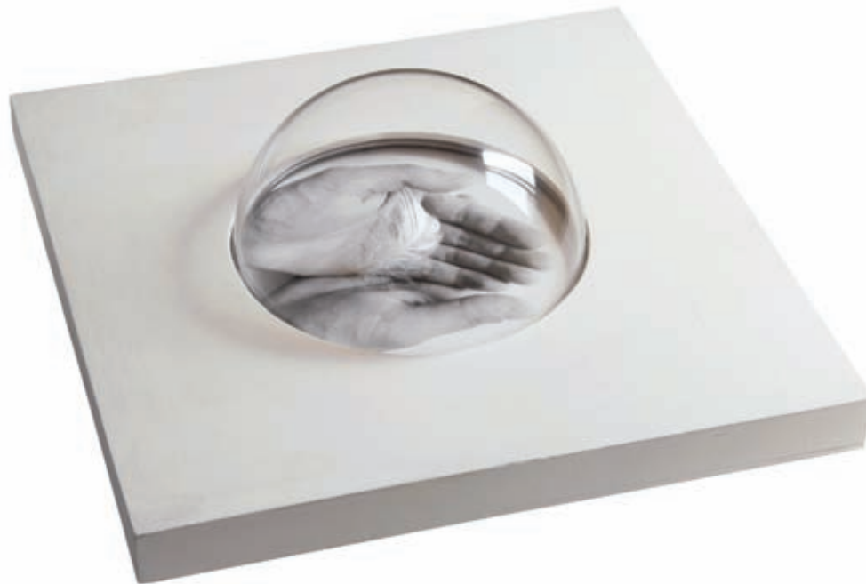
Mano sosteniendo pluma. Emulsión fotográfica y pluma en técnica mixta. Barcelona, 2008. 10 x 30 x 30 cm.